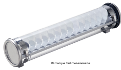
Gounod 133