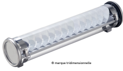
Gounod 133