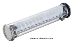
Gounod 133